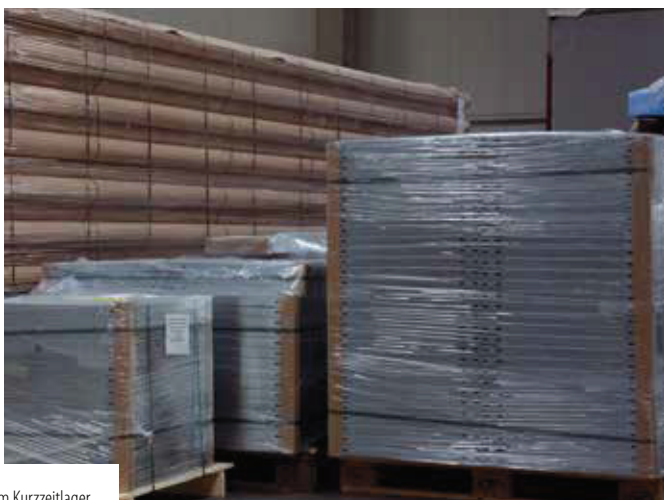
Verschiedenste Güter im Kurzzeitlager